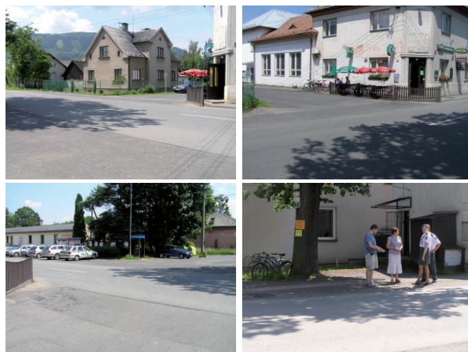
Křižovatka „U dubu“ z různých pohledů - bezpečnost chodců, cyklistů, ... ?