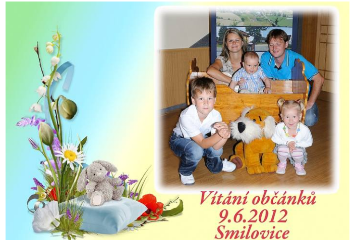
Vítání občánků 9.6.2012 Smilovice

Bitarova ze Slovenska měli naši občané možnost se zúčastnit dvou akcí, a to u příležitosti „Pochování basy“ a „Dne matek“. Obě akce se všem zúčastněným velmi líbily.