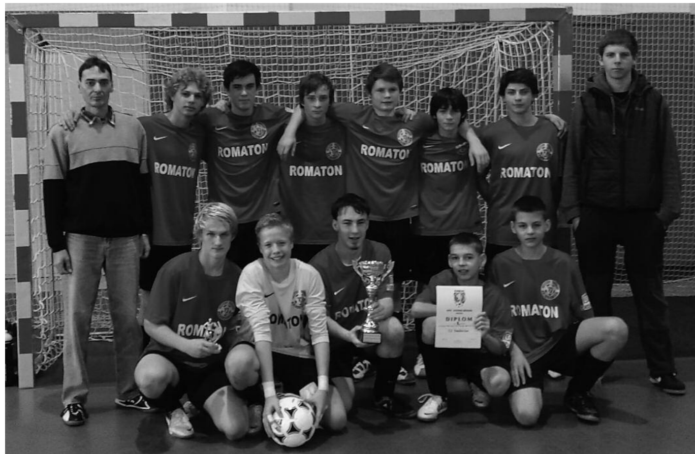
Na fotografii je družstvo dorostenců na zimním halovém turnaji, kde postoupili dorostenci do krajského finále