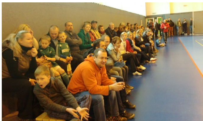
Turnaj přípravek roč. 2006, znovu plné tribuny

Neděle 9.11. roč. 2007, účast 8 družstev. 1. SFC Opava, 2. MŠK Žilina (SK), 3. TJ Velká Polom. Příští turnaj 8.2.2015.