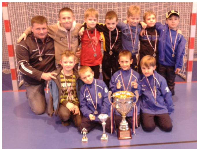
Opavští si na jeden rok odvázejí putovní pohár

Neděle 16.11.roč. 2006, účast 10 družstev. 1. Sparta Zabrze (PL), 2. SFC Opava, 3. MŠK Žilina. Příští turnaj 1.2. 2015.