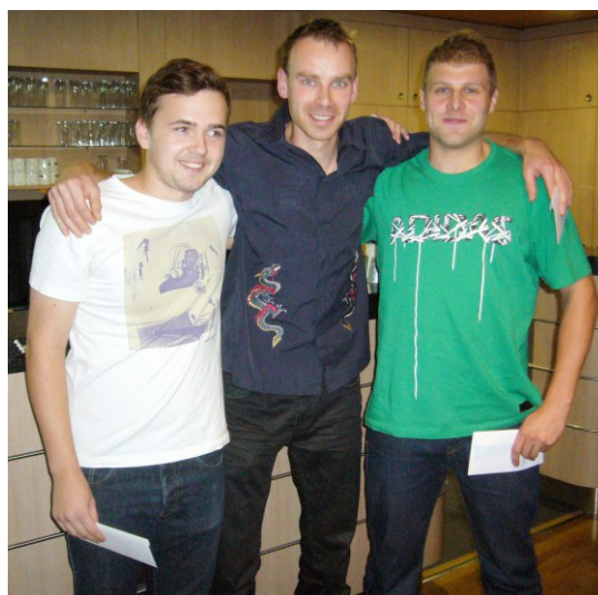
3 nejlepší hráči