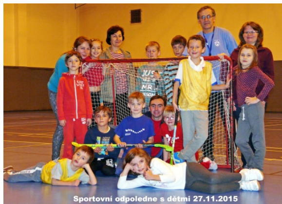
Sportovní odpoledne s dětmi 27.11.2015