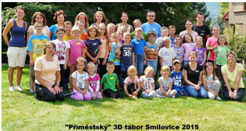
„Příměstský“ 3D tábor Smilovice 2015

Na odpoledních workshopech se vyráběly například auta poháněná vzduchem pomocí nafukovacího balonku, ozdobné rámečky na fotky, netradičně ozdobené plechovky nebo postavičky z Fimo hmoty.