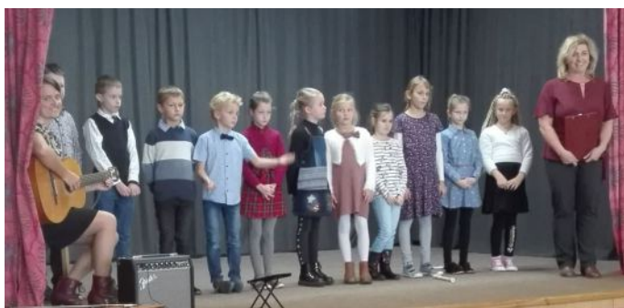
Vystoupení žáků ZŠ na kulturní akcích v obci, Vítání občánků a při Setkání jubilantů a seniorů, počátkem listopadu 2021